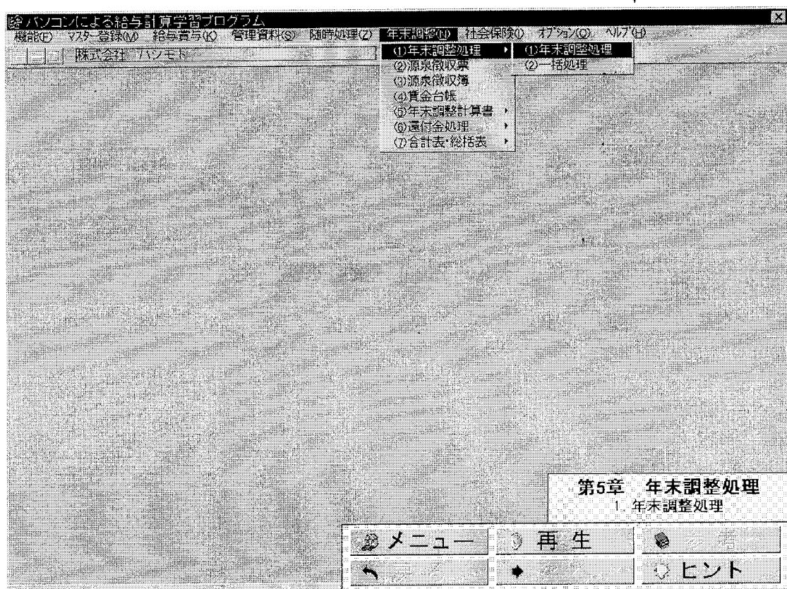
図5 - 1 年末調整処理