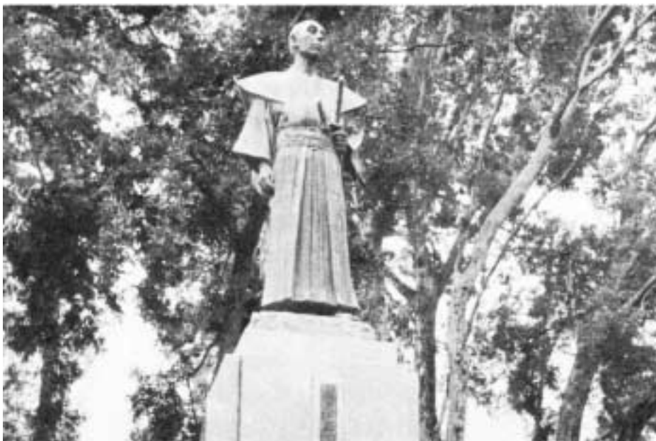
写真3 熊本市小楠公園にある横井小楠の記念像

明治初期には文部省と東京大学が水道橋北詰にある昌平黌と同居していたが、それは小楠の言う実学融合を形の上では実現しているようだが、儒学者と神学者が権力争いでいがみ合い、收拾がつかなくなり、遂に東京大学が一時廃校になった経緯がある。その時、松陰の弟子であった木戸孝允は老儒は最早不要だとして、儒学を棄てて欧米流の学制改革に邁進した経緯があった。小楠が生きていたら大論争になったであろう、議論が本筋を外れて居るからである。老儒には確かに労害があった、大半の老儒は小楠に言わせれば全く実学でもなければ朱子学でもない権力の座に座って自己の私心と保身に汲々とするだけの俗人であったからである。俗人が学問の場を混乱に陥れたのであった。学問と議論の場は近接