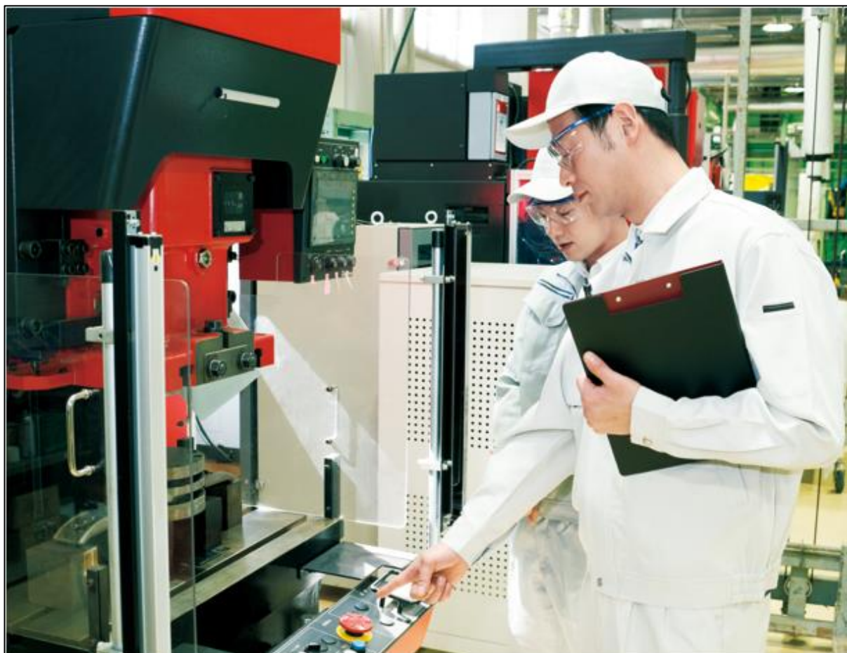
リーフレット（表紙）