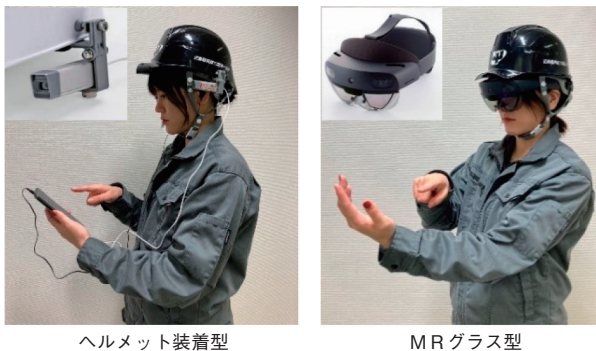
図2 ウェアラブルカメラの選定

ウェアラブルカメラの選定にあたって、ヘルメット装着型とMRグラス型(図2)の2機種を比較検討した。まず、ヘルメット装着型(エレコム社製ウェアラブル対応WEBカメラ [2] )は、既存のヘルメットへ容易に後付けできる利点がある。しかし、装着位置が側頭部に限定されるため、作業者の視線とカメラ映像に「ずれ」が生じることが課題となった。また、通信時にスマートフォン等の外部端末を常時接続する必要があり、配線による作業性の低下や、屋外環境における接続の煩雑さも懸念された。これに対し、今回採用したMRグラス型(マイクロソフト社製HoloLens2 [3] )は、通信機能を本体に内蔵したスタンドアロンのデバイスである。外部端末を介さず単体で通信可能なため、完全なハンズフリー環境を実現できる点が大きな優位性である。さらに、カメラが作業者の眉間付近に配置されているため、学生視点と共有映像がほぼ一致する。これにより、高力ボルトの締付け状況やマーキングの有無を正確に把握でき、的確な指示・確認ができた。