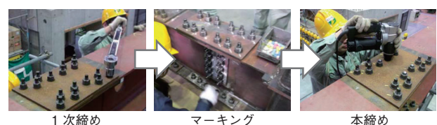
図1 高力ボルトの締付け作業

なお、遠隔臨場での実習は、現場での安全性の確保が困難であることから、別途、現場に指導員を配