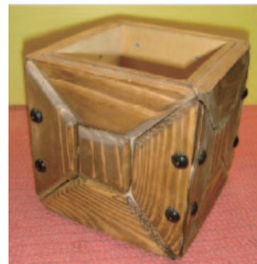
「パネルキューブ」完成品