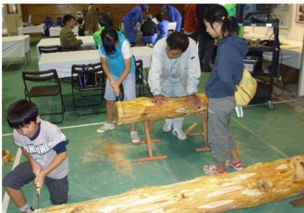
図1 丸太切り体験の様子