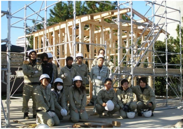
図4 上棟実習課題完成の様子

部材から筋かい、垂木などの羽柄材の組み立て、解体までより大工実務に近づけた形でその心得を含めて5日間の予定で実施している（図3、図4）。