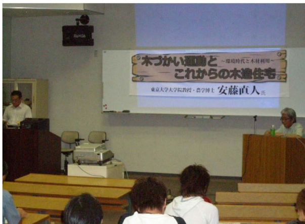
図5 公開講座の様子

毎年秋に千葉土建技術研修センターと公開講座を共同開催している。今年度も10月15日（金）に予定されているが、この講座もすでに3回を教え、各回80名程度の参加がみられている。テーマは社寺建築の構造や木にまつわる話題性のある話を土建会員のほか高校生から一般の方まで幅広く聞いていただいている。伝統的手法にとらわれない新しい技術の提