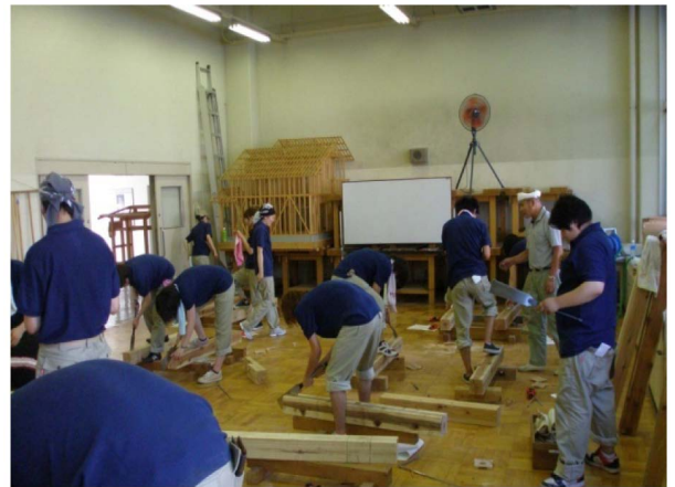
図2 継ぎ手実習の様子

工実習 I にて木材を扱った実習を行っている。指導には千葉土建技術研修センターならびに技術対策部から技能伝承という目的と若手技能者育成の一環として協力いただいている。図2は継手の加工実習を行っている風景である。追掛け大栓継ぎと金輪継ぎが主な課題である。5日間の実習を通して正しい道具の使い方から先人の築き上げた技術的な知恵を踏襲し、さらに工夫を重ねることによって今後のものづくり技能者としての感覚を身につけている。