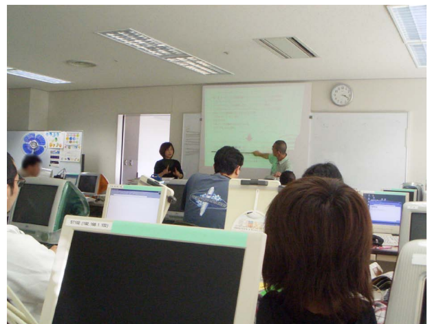
写真1 パソコン室での手話通訳の様子 黒い服の女性が手話通訳者

手話通訳者は生徒が手話を見られる状態かどうかを、指導員に注意を促してくれる存在でもあります。はじめのうちは、手話通訳者が「今、ノートをとっていますから説明を始めないでください」と、説明を中断するよう求めるシーンがしばしばでした。私の場合、（健常者に対する）以前の指導では、訓練で説明するときには、テキストを読ませながら口頭での説明を加えたり、板書を写している最中に次の説明を始めたり、ということが大半でした。しかし今回、聴覚障がいの生徒を意識して「板書しながら説明する」「板書を写させる」「テキストを読ませる」という3つの作業を明確に分けて行うと説明に時間がかかったので、説明する内容は要所要所を押さえることに心掛けるようにしました。また、視線の移動を少なくする工夫として、説明中にはテキストを使用せず、板書を主に使用してその訓練時間の最後に「本日の説明内容は教科書〇ページでした」と示すようにとどめるという方法も現在試行しています。