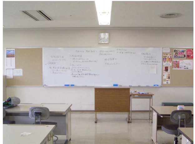
写真2 ある日の板書 説明、指示、質問への回答などが混在してしまう

はじめのうち、手話通訳者が不在の日は板書を細かく行うことで対応してみました。それは、自分が発した言葉を、すべて板書するぐらいでした。