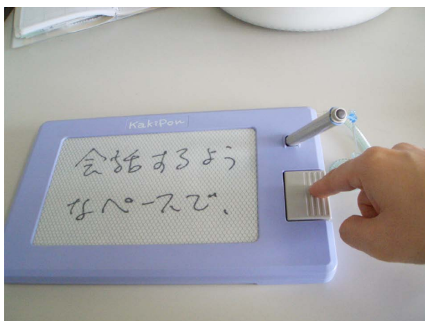
写真4 簡易筆談器 KakiPon (株式会社ワールドパイオニア製)

りないためです（何かに夢中になっていてこちらに注目してくれない場合には、本人の見ている所にこちらの手をかざすところを向いてくれます）。光で合図するのは人間的でないような感じもします。したがって、もし回転灯などを使用するなら、「定時に鳴るチャイムと同期している」、「危険を知らせるブザーとともに点灯する」、など、音で知らせる器具と連動しているのが良いと思います。